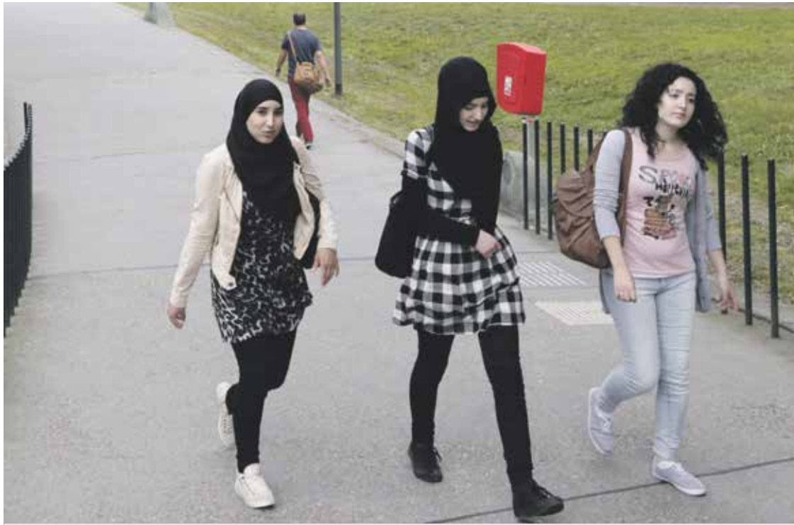
Studenten op de campus van de Technische Universiteit Eindhoven

HBO MAGAZINE editie 279 | mei | juni 2019