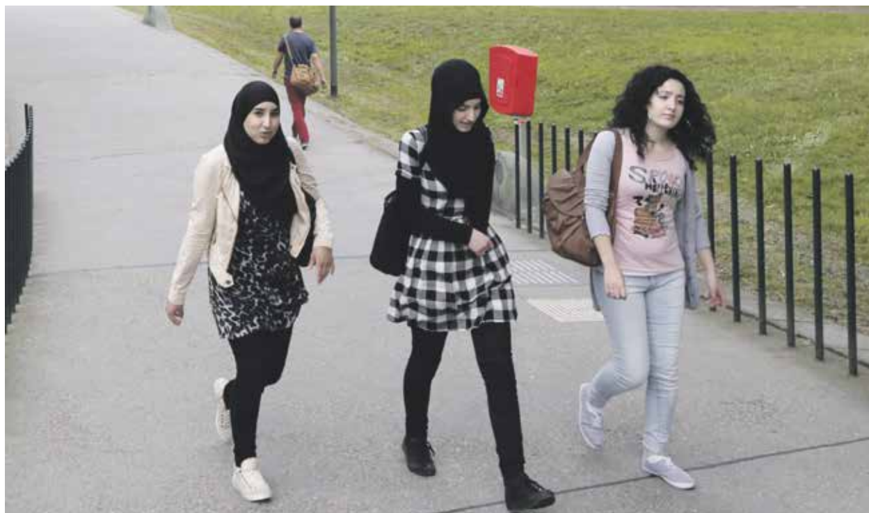
Studenten op de campus van de Technische Universiteit Eindhoven